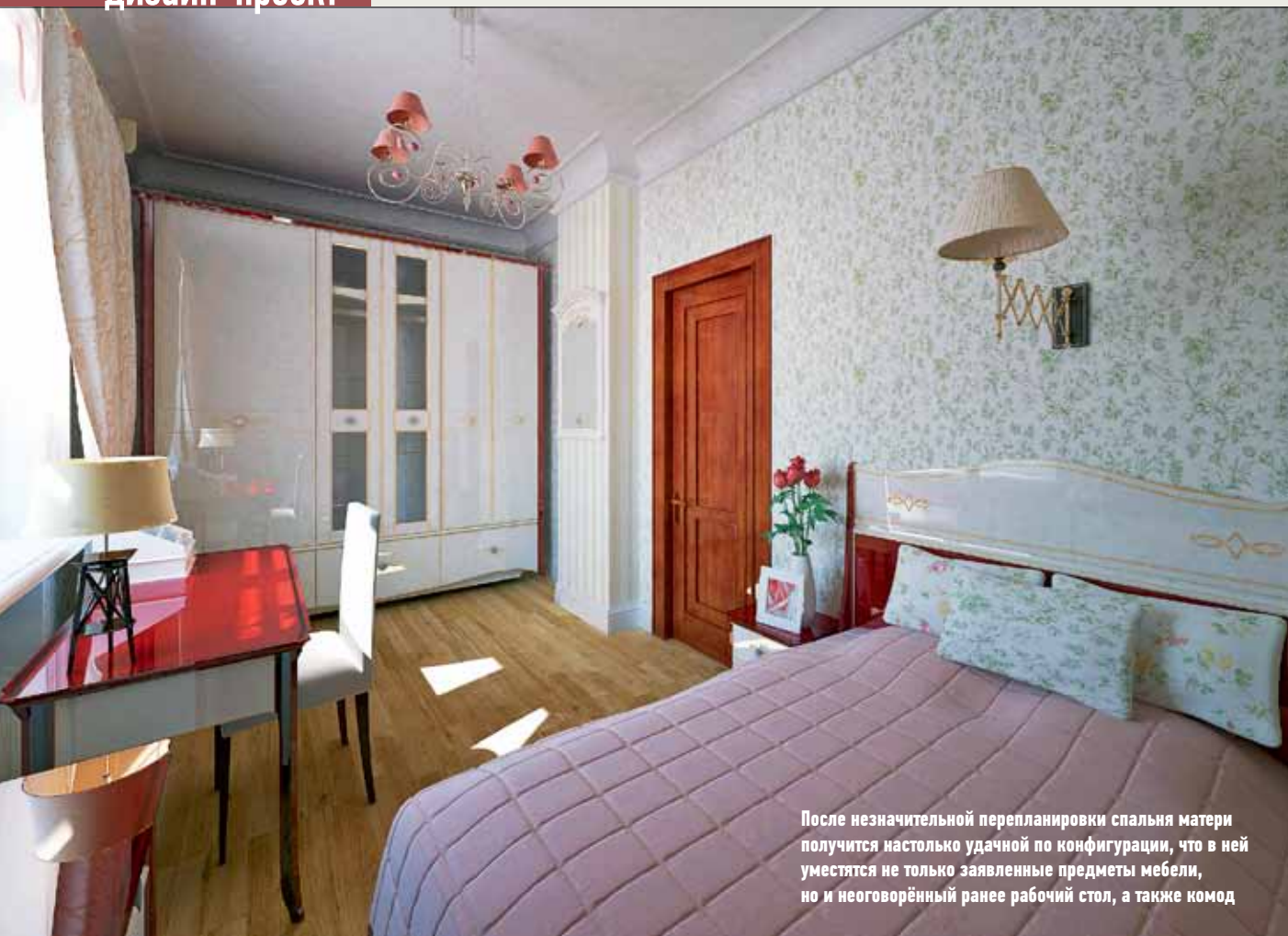
После незначительной перепланировки спальня матери получилась настолько удачной по конфигурации, что в ней уместятся не только заявленные предметы мебели, но и неоговорённый ранее рабочий стол, а также комод

➔ В квартире высокие (трёхметровые) потолки. Чтобы небольшие помещения, как, скажем, спальня дочери или гостиная, не превратились в «колодцы», предполагается обшить потолки широкими карнизами, выкрашенными в довольно тёмный тон. Аналогичным образом планируется выполнить и плинтусы. Благодаря этому, возможно не самому распространённому решению, потолки в малогабаритных комнатах будут казаться существенно ниже